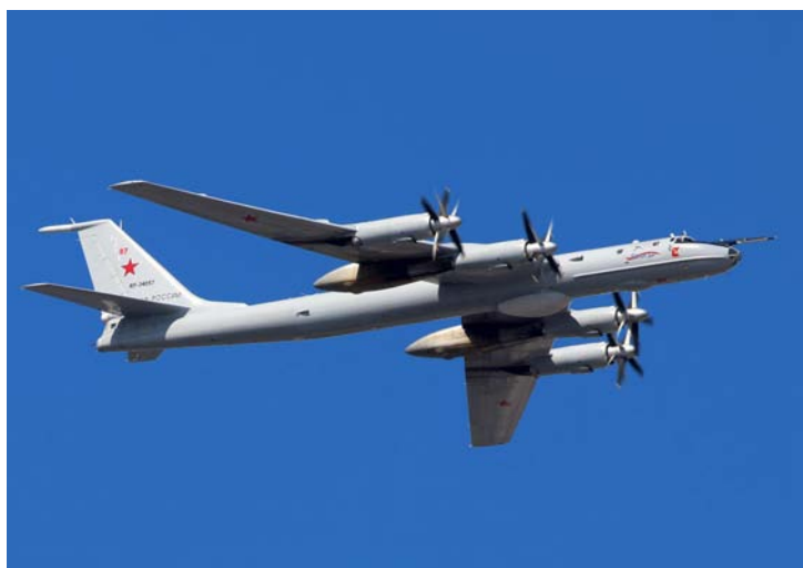
Дальний противолодочный самолет Ту-142МК ВМФ России (бортовой номер: RF-34057/97) Вологда. Участник главного морского парада в Санкт-Петербурге 2020 г. Обратите внимание на отсутствие обтекателя в носу.

Ремонт и модернизацией Ту-142 ПАО «ТАНТК им. Г.М. Бериева» занимается и в настоящее время.