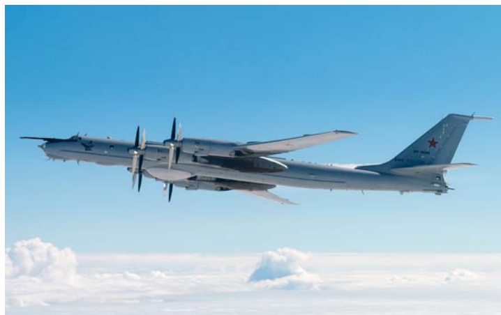
Дальний противолодочный самолет Ту-142МЗ ВМФ России (бортовой номер: RF-34098/64). 2020 г. Обратите внимание на обтекатель поискового комплекса в носовой части фюзеляжа.