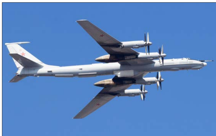
Самолет-ретранслятор Ту-142МР (бортовой номер: RF-34073/17). В обтекателе под центропланом крыла находится выпускная тросовая антенна длиной несколько километров для связи с подводными лодками. Обратите внимание на обтекатель на киле направленный вперед и отсутствие остекления в носовой части самолета.