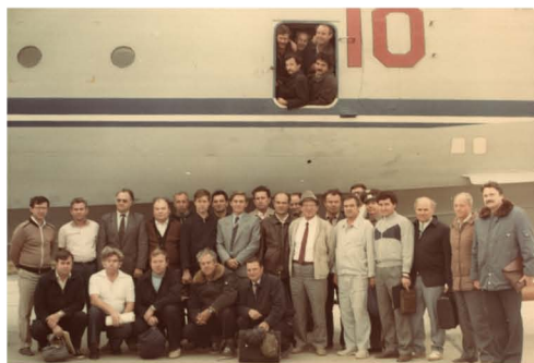
После рекордного полета самолета-амфибии А-40. 1989 г.

Он одним из первых понял, что необходимо предпринять для выживания в новых условиях, когда практически исчез госзаказ, а стартового капитала у фирмы, как и у большинства опытных предприятий, не было. Новый руководитель, сохраняя направление на окончание работ и запуск в серию А-40 и продолжение деятельности по опытному самолету-госпиталю Бе-42, предложил активно заняться конверсионными самолетами-амфибиями Бе-200 и Бе-103, а также переоборудованным под двигатели Pratt-Уитни пассажирским Бе-32К.