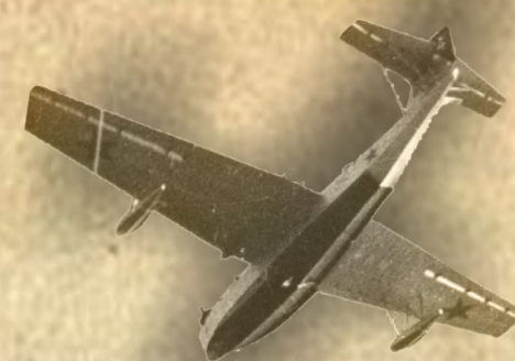
МБР-2 с мотором М-17

Затем был дан обед, на котором гостей познакомили с летным составом, в том числе и с мировым рекордсменом летчиком Гарди Франческо Аджелло. Завершилось посещение школы несколько курьезно. После окончания трапезы, начальник школы удалился, сославшись на служебные дела, Г.М. Бериев с коллегами отправились, вместе с летчиками, прогулялись по парку, окружавшему школу. Сначала беседа шла на различные бытовые