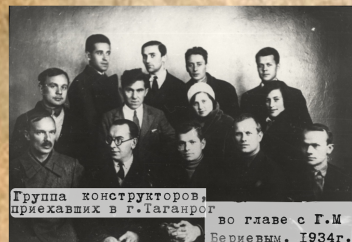
Группа конструкторов, приехавших в г. Таганрог во главе с Г.М. Бериевым, 1934г.