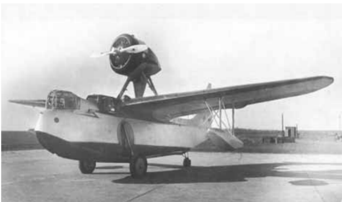
Морской ближний разведчик МБР-5