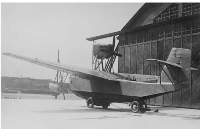
Морской ближний разведчик МБР-2