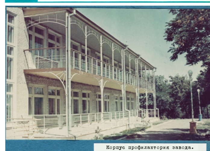
Корпус профилактория завода.