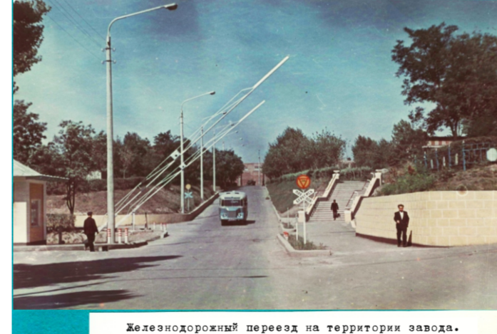
Железнодорожный переезд на территории завода.