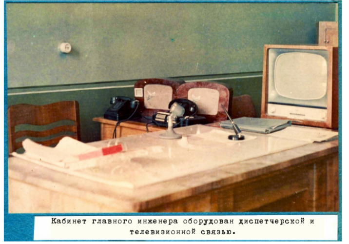
Кабинет главного инженера оборудован диспетчерской и телевизионной связью.