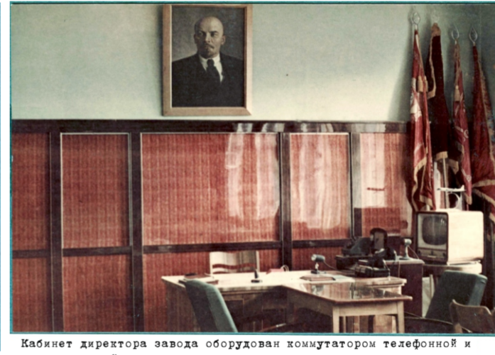
Кабинет директора завода оборудован коммутатором телефонной и телевизионной связи, что дает возможность руководить производством без вызова исполнителя.