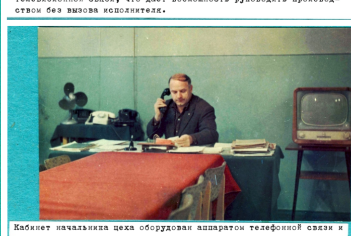
Кабинет начальника цеха оборудован аппаратом телефонной связи и телевизором, которые соединены с производственным участком.