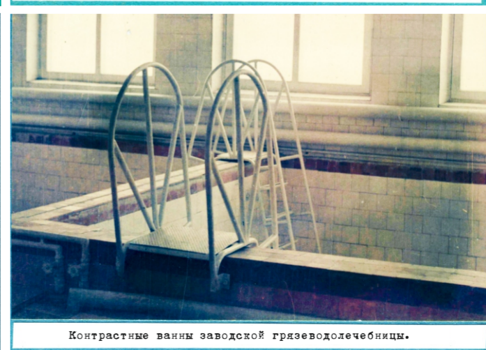
Контрастные ванны заводской грязеислечебницы.