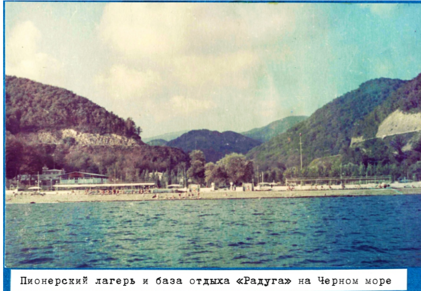
Пионерский лагерь и база отдыха «Радуга» на Черном море