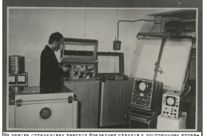
На заводе организован участок фрезерных станков с программным управлением, включающий станок мод.6Н13132, ДФ-66, ФП-7. Расчет и запись программ осуществляется на линейно-ходовом преобразователе ЛПК-2-6Г, работающем в паре с ПКЗ (пульт записи и контроля)