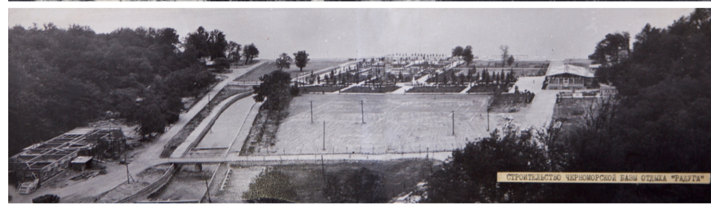
СТРОИТЕЛЬСТВО ЧЕРНОМОРСКОЙ БАЗЫ ОТДЫХА «РАДУГА»