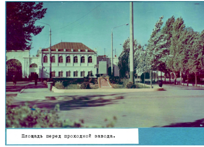
Площадь перед проходной завода.

При разборе материалов из бывшего музея Таганрогского механического завода им. Димитрова (ТАВИА) был обнаружен очень интересный «Иллюстрированный альбом к отчету о проведении общественного смотря культуры производства в честь 100-летия со дня рождения В.И. Ленина за 1968г.». Предлагаем читателям ознакомиться с отдельными выдержками из него. В очередной раз хотелось бы напомнить всем о важности сохранения исторических материалов и подтолкнуть руководство комплекса к решению задачи создания полноценного музея предприятия, объединенного с Музеем авиационной техники, находящимся на военном аэродроме, и с заводским Аэроклубом (деятельность которого в настоящий момент приостановлена). Тем более, что за последнее время таких проектов было рассмотрено множество, правда нужно признать, что идеального решения так и не было найдено.