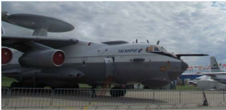
А-50У №41 на стоянке салона

Прошедший «МАКС-2017» стал весьма успешным для ТАНТК им. Г.М. Бериева. Во время выставки прошли деловые встречи специалистов ТАНТК с представителями потенциальных заказчиков, прежде всего из стран Юго-восточной Азии, Ближнего Востока и Латинской Америки. Свой интерес к пожарному варианту Бе-200 подтвердили США и Китай.