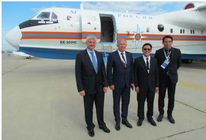
Осмотр Бе-200ЧС делегацией из Таиланда

Прошедший «МАКС-2017» стал весьма успешным для ТАНТК им. Г.М. Бериева. Во время выставки прошли деловые встречи специалистов ТАНТК с представителями потенциальных заказчиков, прежде всего из стран Юго-восточной Азии, Ближнего Востока и Латинской Америки. Свой интерес к пожарному варианту Бе-200 подтвердили США и Китай.