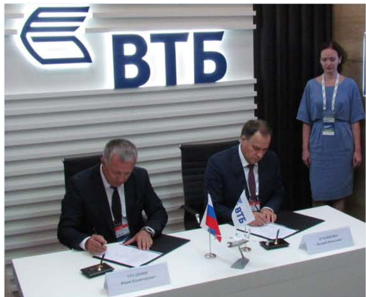
Подписание соглашения с ВТБ

В рамках «МАКС-2017» ТАНТК им. Г.М. Бериева и банк ВТБ заключили соглашение о сотрудничестве. Соглашение призвано стать базой для дальнейшего расширения сотрудничества ТАНТК и ВТБ по широкому перечню направлений услуг в банковской и финансовой сферах. Ключевым предметом соглашения является взаимодействие сторон в рамках реализации проекта поставки самолетов-амфибий Бе-200ЧС и Бе-103 на внутренний рынок и на экспорт. Документ также предусматривает возможность финансирования текущей деятельности и инвестиционных проектов.