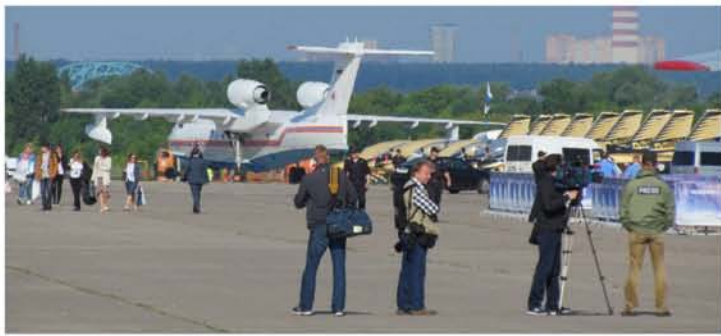
Бе-200ЧС №304 на стоянке салона