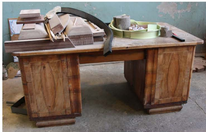
Стол, ожидающий реставрации

На Модельном участке цеха №40 ждет реставрации стол Г.М. Бериева.