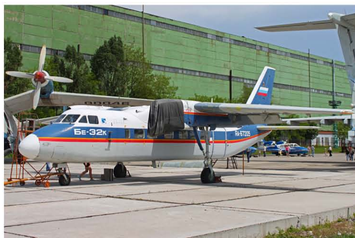
Самолет МВЛ Бе-32К