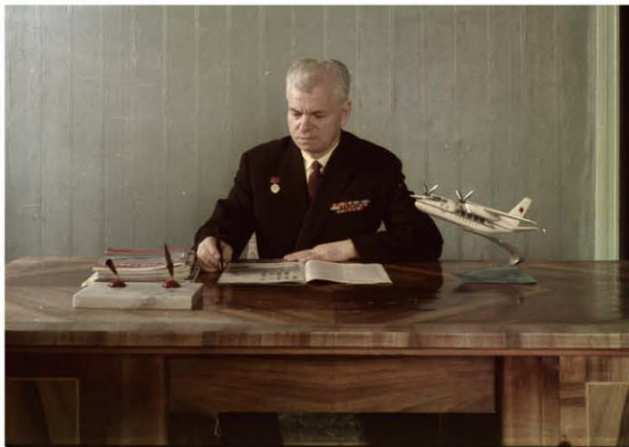
Г. М. Бериев за рабочим столом

Многие еще помнят, как из цехов завода им. Димитрова каждый месяц выкатывали новый Ту-142 «полностью таганрогской сборки»; как поднимали в небо самолеты-амфибии А-40, которыми восхищалась вся планета; как устанавливались многочисленные мировые рекорды на самолетах-амфибиях А-40 и Бе-200.